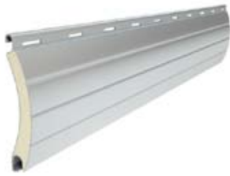
PA 52 Înălțime profil: 52 mm Grosime: 13 mm

Profil din aluminiu umplut cu spumă poliuretanică: