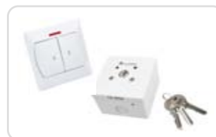
Intrerupator cu cheie sau buton