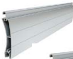
PE 55 Înălțime profil: 55 mm Grosime: 14 mm