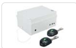
Unitate de comandă cu telecomandă