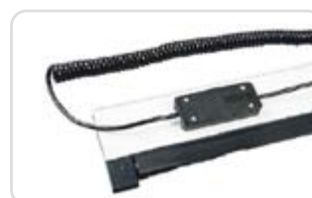
Bară sensibilă la atingere