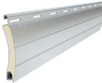
PA 55 Înălțime profil: 55 mm Grosime: 14 mm