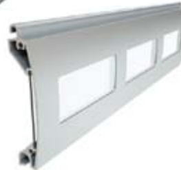
PER 77 Înălțime profil: 77 mm Grosime: 18,5 mm