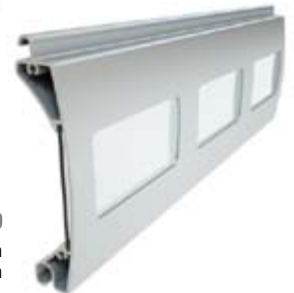
PER 100 Înălțime profil: 100 mm Grosime: 25 mm