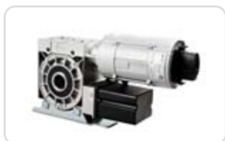
Mecanism de acționare