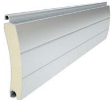
PA 77 Înălțime profil: 77 mm Grosime: 14 mm