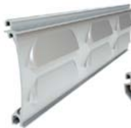
PEW 77 Înălțime profil: 77 mm Grosime: 14,5 mm