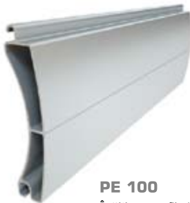
PE 100 Înălțime profil: 100 mm Grosime: 25 mm